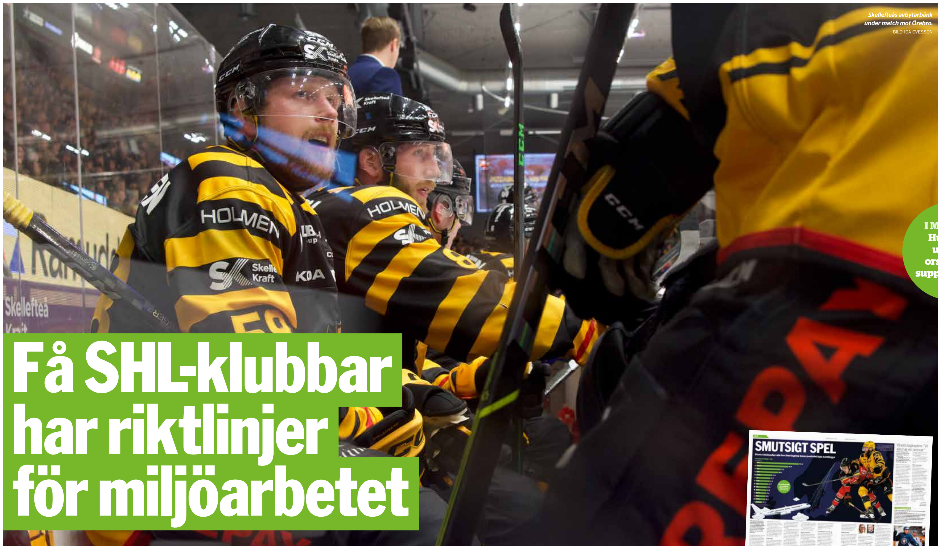
Skellefteås avbytarbänk under match mot Örebro.

I MORGON: Hur stora utsläpp orsakas av supportrarna?