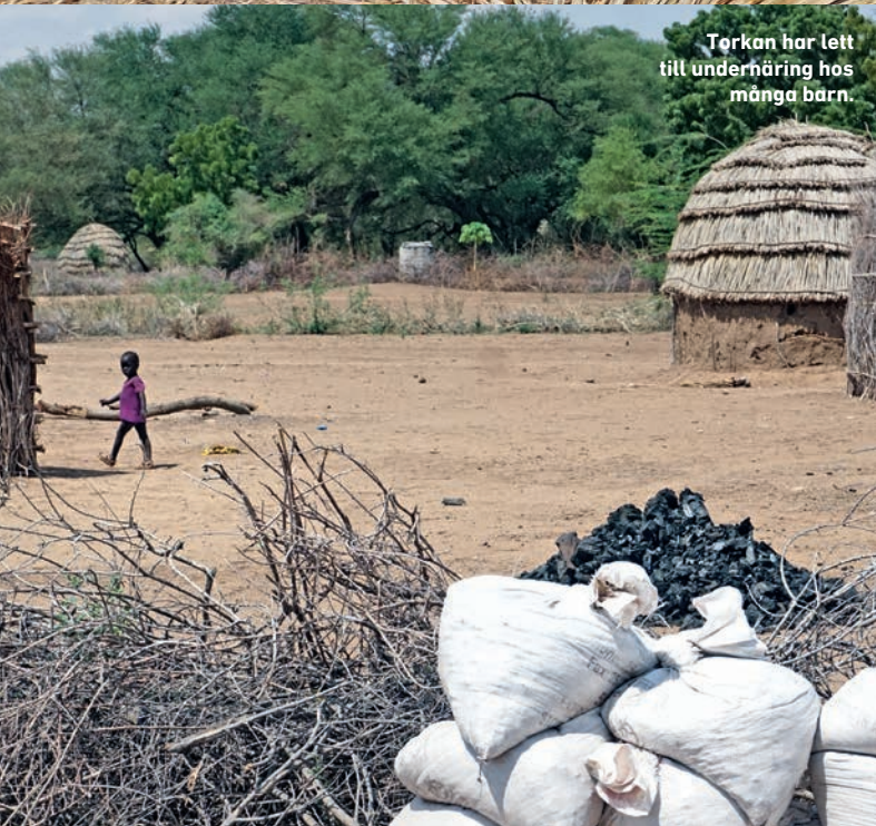
Terkan har lett till underhåring hos många barn.