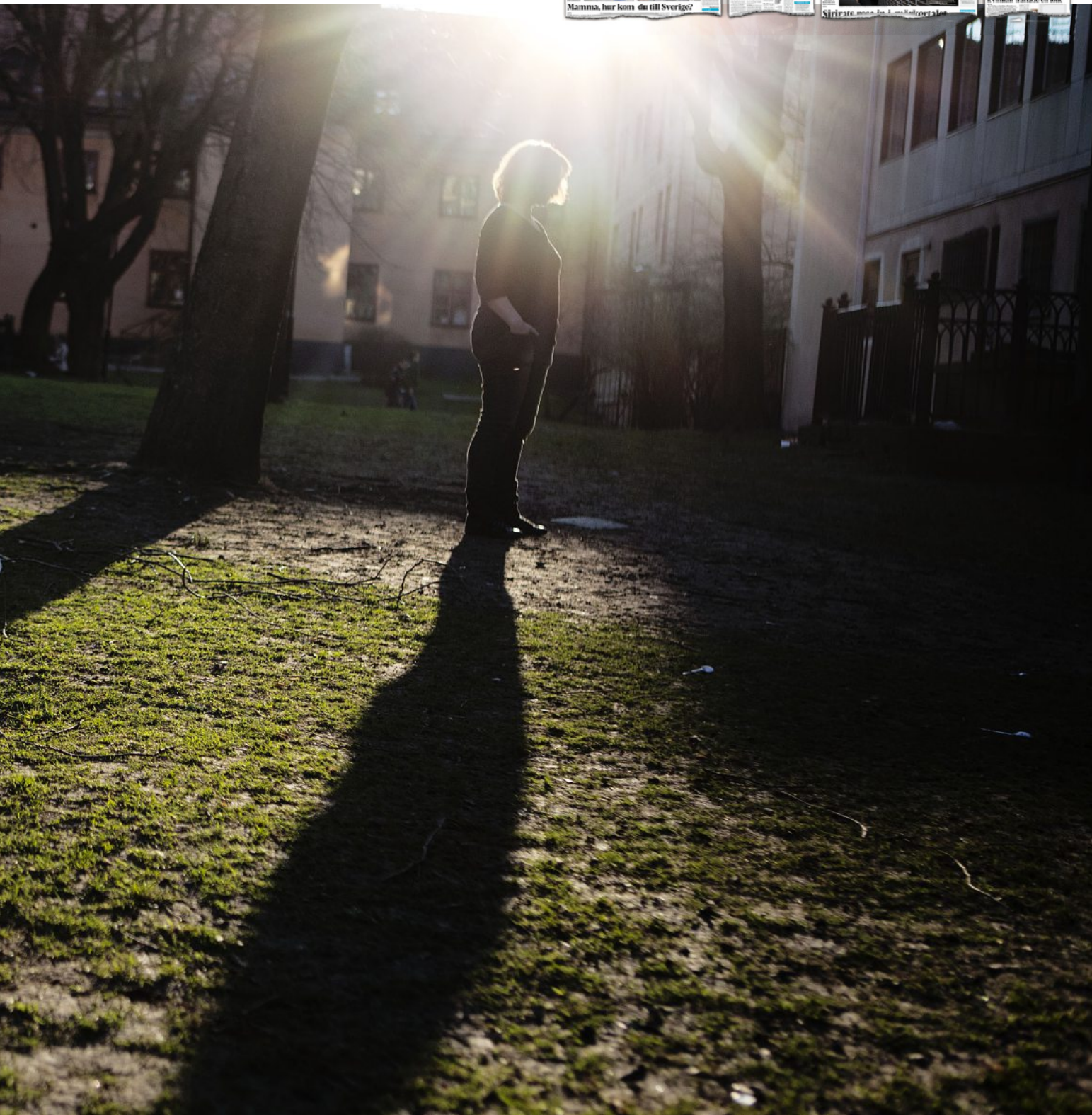
som skulle komma att bli ett helvete.