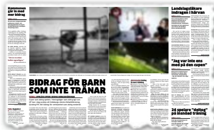
GP I GÅR.