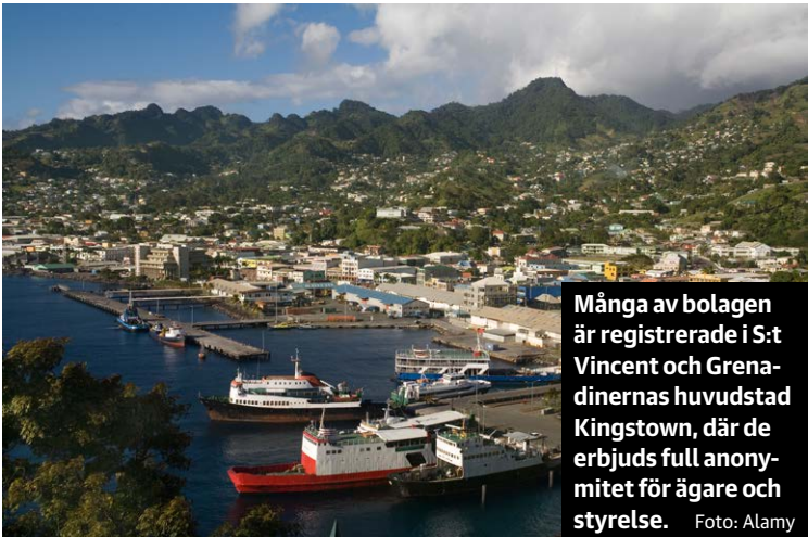
Många av bolagen är registrerade i St Vincent och Grenadinernas huvudstad Kingstown, där de erbjuds full anonymitet för ägare och styrelse.

I nio fall har en svensk advokat vidimerat dokumenten – samma advokat återfinns i domstolshandlingarna kring det stora narkotikamålet som en av försvararna till 44-åringen från Eskilstuna.