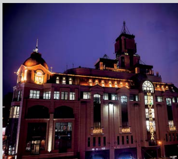
Callcentret i Kiev.

Här mitt i centrala Kiev finns callcentret med hundratals anställda som ringer runt till offer över världen. Bolaget heter Milton Group och avslöjades i början av mars. De erbjuder investeringar i bitcoin och andra värdepapper men investeringarna är falska och offren förlorar hela det satsade beloppet.