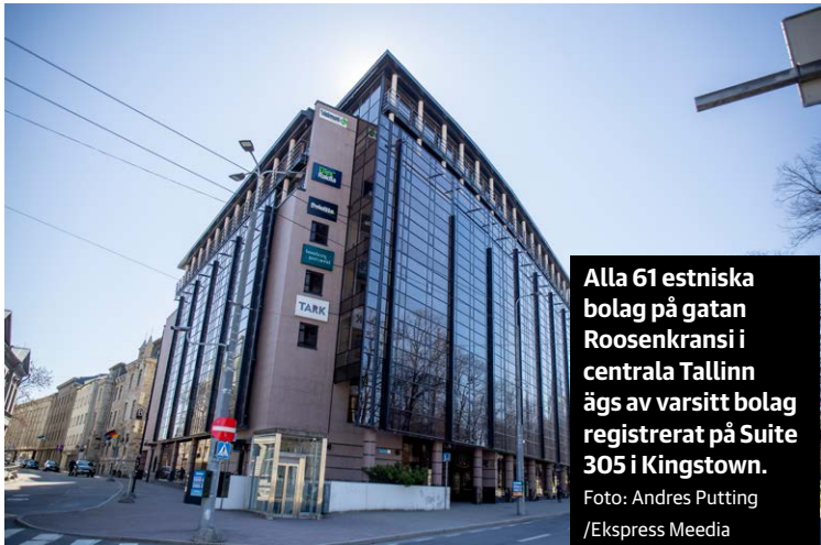
Alla 61 estniska bolag på gatan Roosenkransi i centrala Tallinn ägs av varsitt bolag registrerat på Suite 305 i Kingstown.