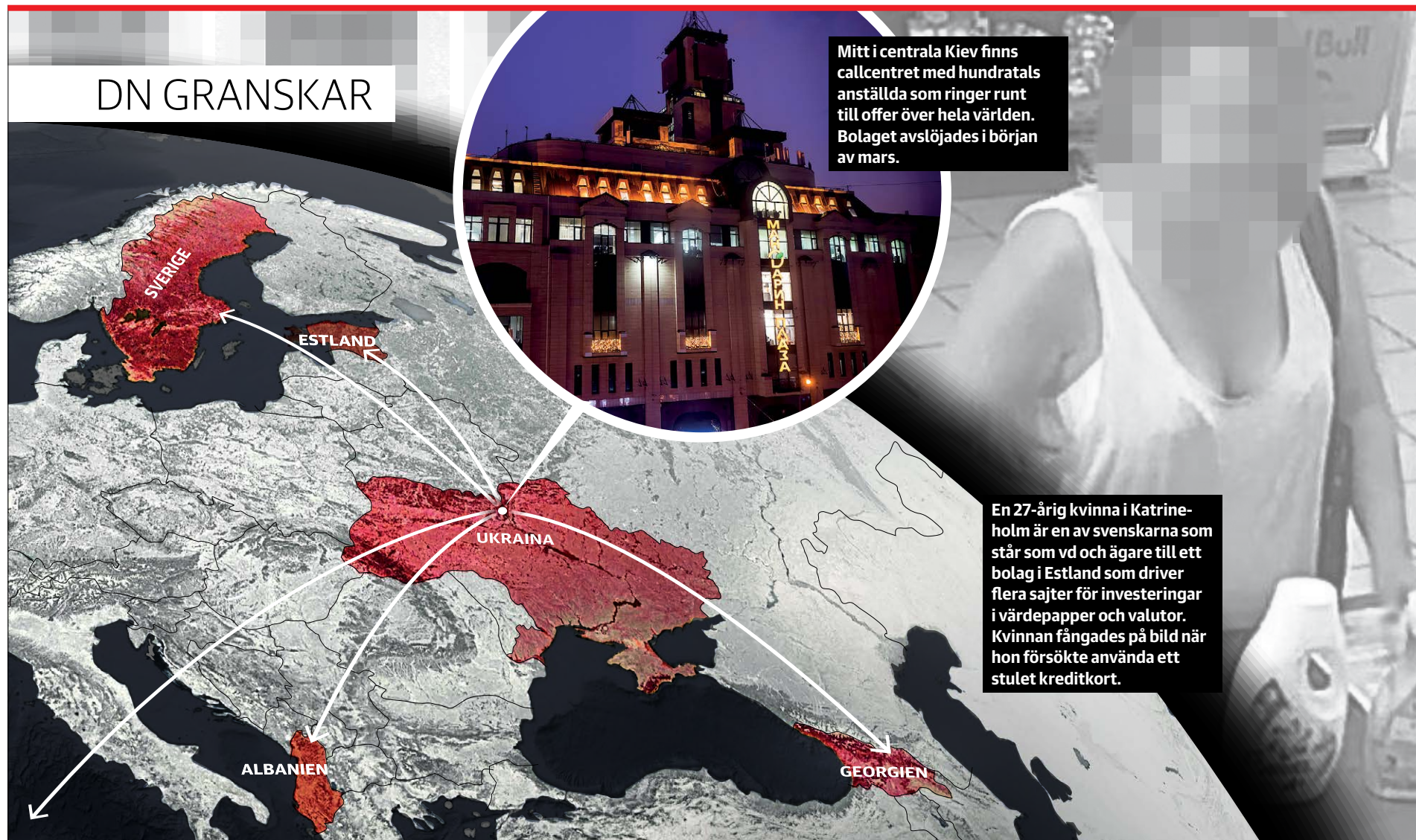
Grafik: Jonas Backlund