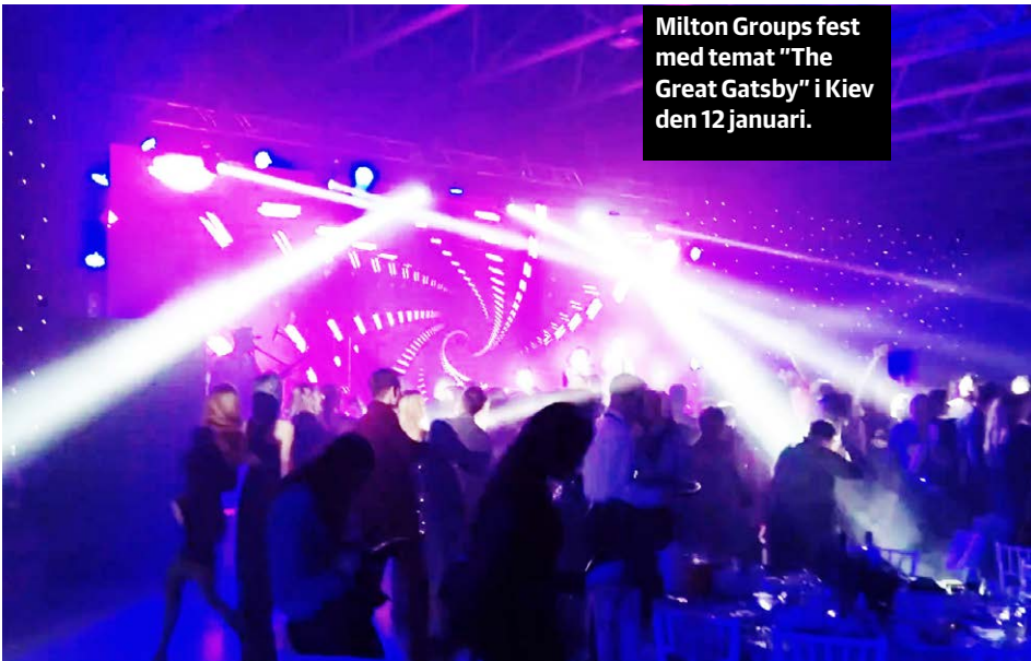
Milton Groups fest med temat "The Great Gatsby" i Kiev den 12 januari.