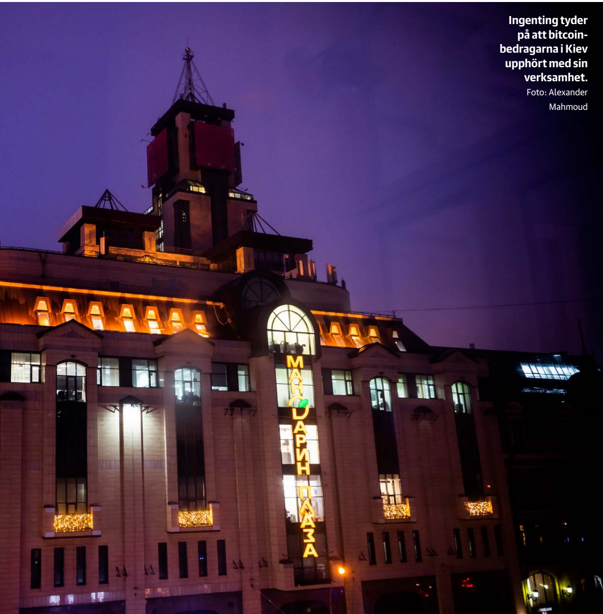
Ingenting tyder på att bitcoin-bedragarna i Kiev upphört med sin verksamhet.