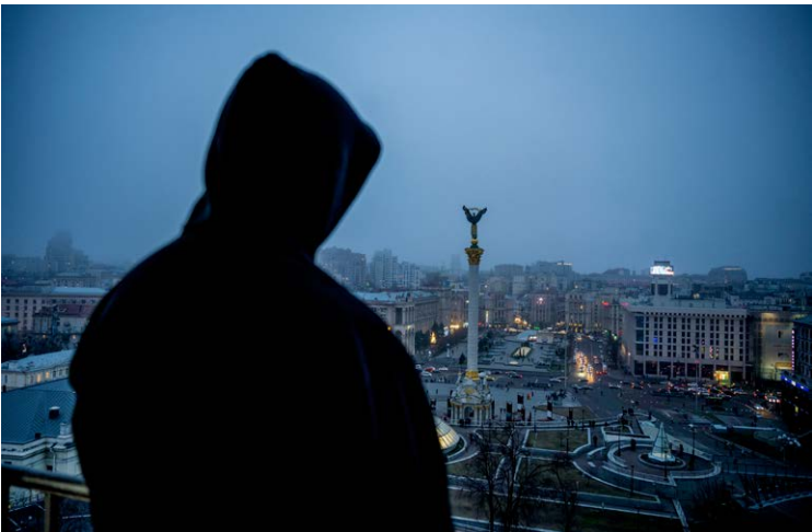
Visselblåsaren "Alexej" dokumenterade Milton Groups verksamhet och lämnade över sitt bevismaterial till svensk polis.