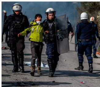
Polis sattes in mot migranter på den grekiska ön Lesbos.