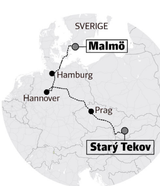
Vapnens väg från Starý Tekov till Skåne. Grafik: Alexander Rauscher