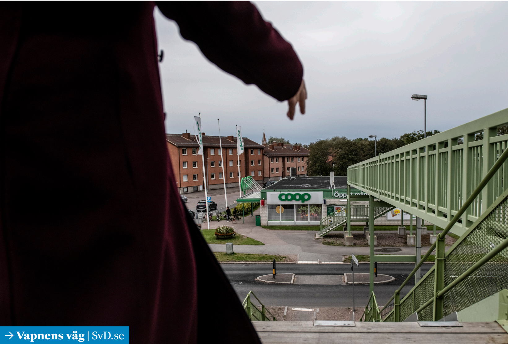
→ Vapnens väg | SvD.se

43-åringen hämtade ut vapenpaketen hos Coop i Krylbo. 289 skjutvapen hamnade på svarta marknaden med hjälp av mannens jaktlicens.