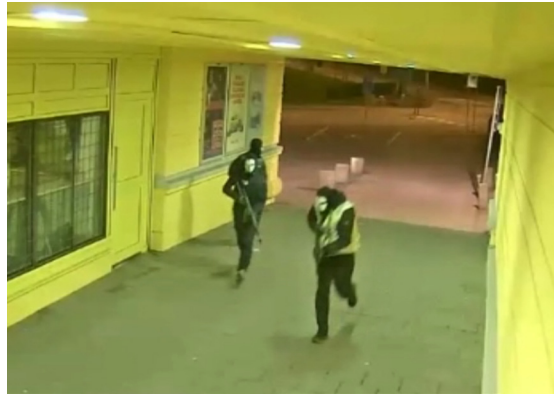
Vid massakern på Värvåderstorget användes vapen som hade smugglats in från Slovakien.