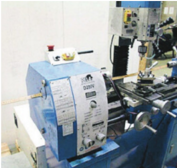
Den här svarven som stod i verkstaden i Vellinge tros ha använts för att göra de insmugglade vapnen skjutklara.