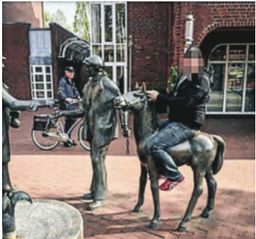
Den misstänkta Vapensmeden fixar och provskjuter vapnen innan de sprids vidare. Här syns han i staden Zeven i Tyskland.