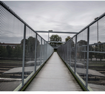
Järnvägsspåren skär genom orten.

Har du information och vill tipsa oss? Kontakta våra reportrar direkt via mejl eller via vår krypterade tipsartjänst Secure Drop. SvD.se/securedrop