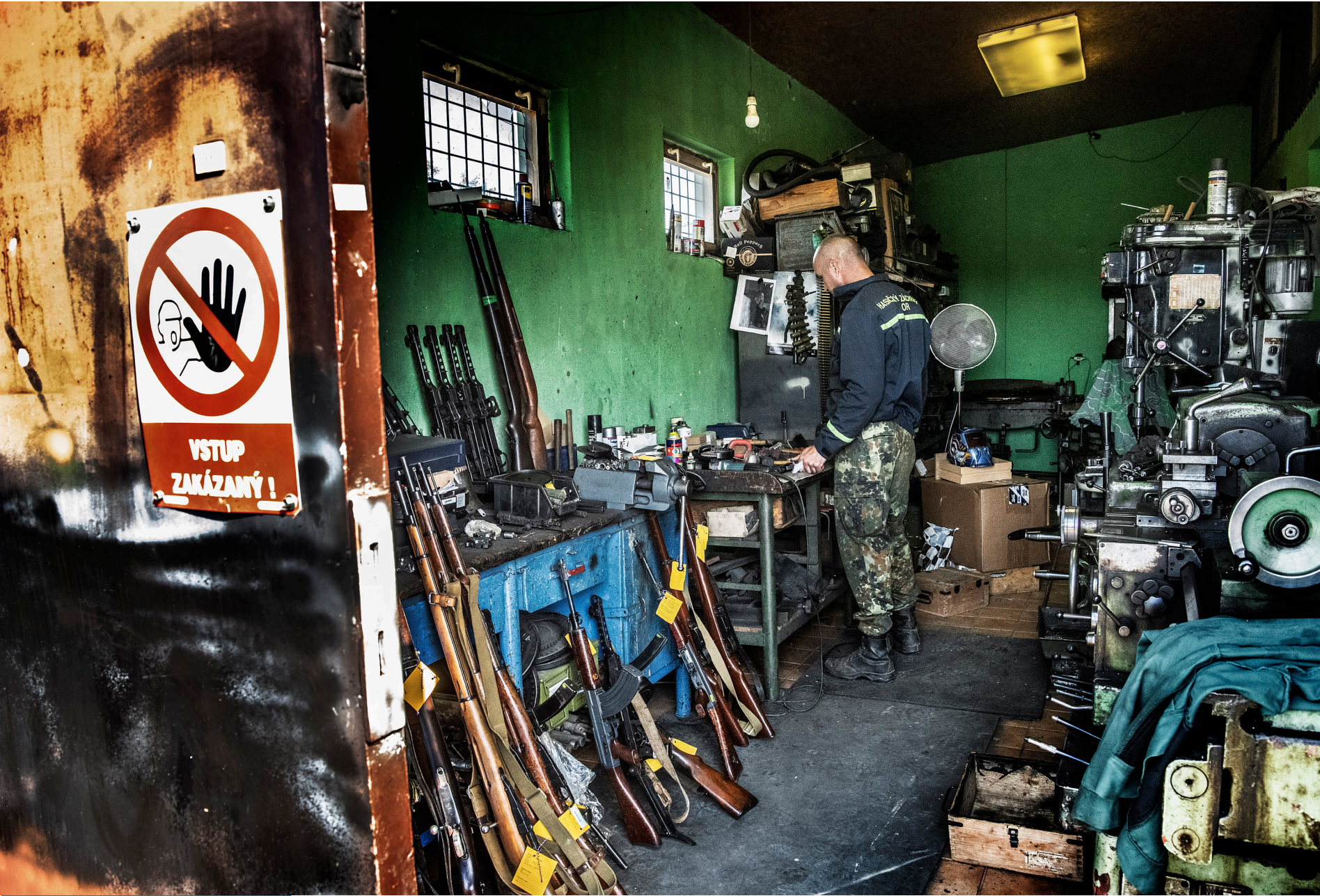
→ Vapnens väg | SvD.se Det var hos vapenhandlaren Tassat som de tre svenskarna i Skånenätverket köpte sina vapen. Butiken ligger i den lilla slovakiska byn Starý Tekov, två timmar öster om Bratislava.