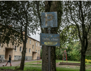
Arbetslösheten är hög i Avesta kommun, som Krylbo tillhör.

att han bara hade sålt till personer som lovat att de skulle ansöka om licens. Det trodde varken polisen eller domstolen på. Framför allt för att vapnen aldrig hittats. Dessutom saknas kvitton.