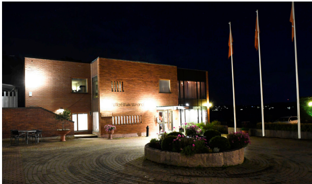
I Villa Elfvik på Lidingö hölls samtalen i fjol.