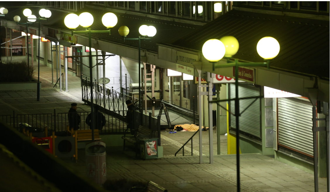
En livlös kropps täcks av en filt vid en restaurang på Värvåderstorget i Göteborg den 18 mars 2015. Fem personer dömdes senare för inblandning i massakern som krävde två människoliv. Vapnet som användes vid massakern provsköts av Vapensmeden innan det såldes till gärningsmännen.