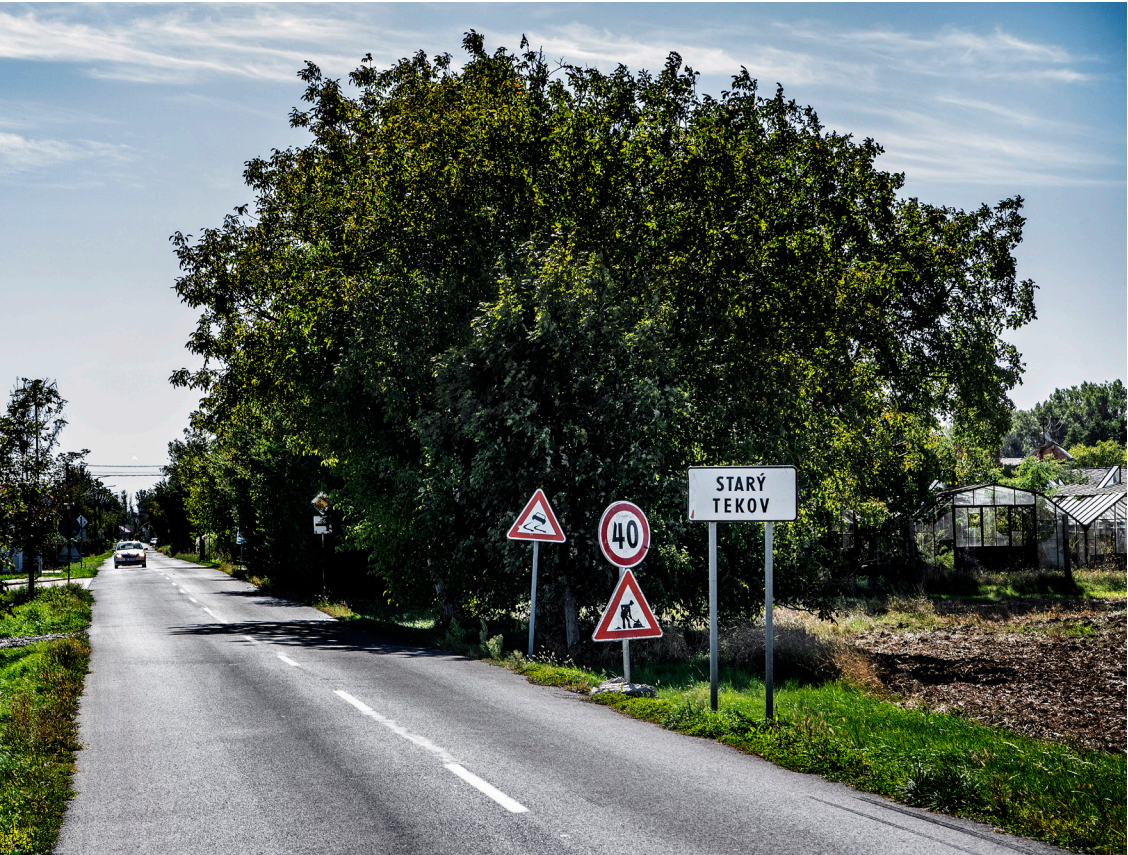
I byn Starý Tekov bor omkring 1500 personer. Via en vapenbutik i den annars slumrande idyllen har hundratals vapen hamnat i kriminellas händer.