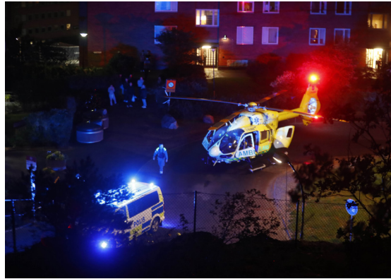
Bara under det senaste året har det inträffat i snitt nästan en skjutning per dag.

→ SvD.se VAPNENS VÄG Vapnens väg Premium En granskande artikelserie om vapnen som strömmar in i de svenska gängkonflikterna. SvD.se/vapnens-väg