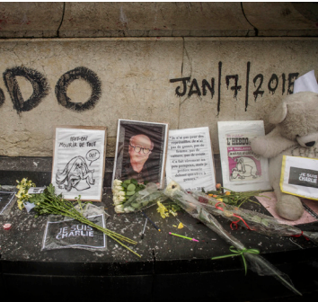
Vid terrordådet mot tidningen Charlie Hebdo användes samma sorts vapen som Skånenätverket smugglat in i Sverige.